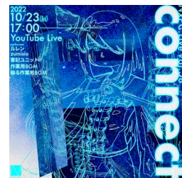
NxPC.Live vol.58 connect

慶応義塾大学 SFC の徳井研究会を招いて、久しぶりの東京でのイベントを実施予定。