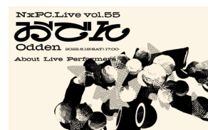
NxPC.Live vol.55 おでん