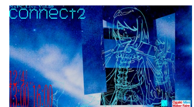
NxPC.Live vol.59 connect2