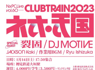
NxPC.Live vol.60 CLUBTRAIN 2023 ネオ天国