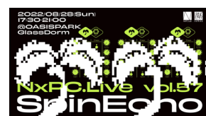
NxPC.Live vol.57 SpinEcho